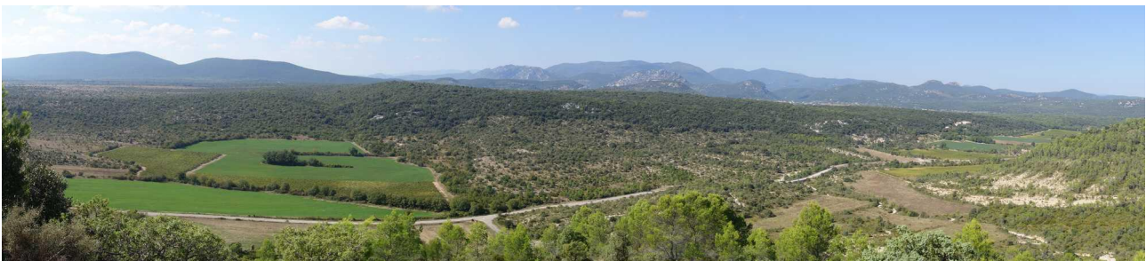
La plaine de Pompignan avec les Cévennes en arrière plan

Ce territoire préservé, dont le paysage a été façonné par l'agriculture et la sylviculture, est utilisé par de multiples activités socio-économiques. Ses composantes naturelles et semi-naturelles restent importantes.